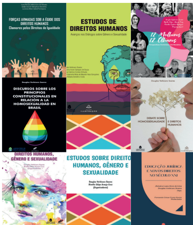
Figura I - Alguns Livros do LADIHGES Publicados