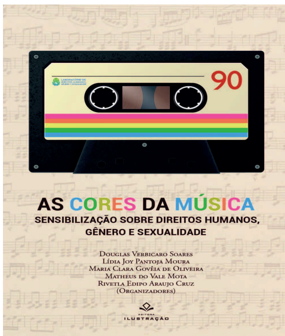
Figura 3 – Imagem da capa da coletânea As Cores da Música